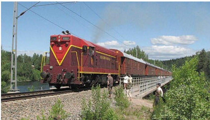
T42 205 kommer att vara den huvudsakliga dragkraften på Haparandaresan. Bilden ovan är tagen på IB08-resan 2008-06-09.

Resan är ett samarbetsarrangemang mellan: